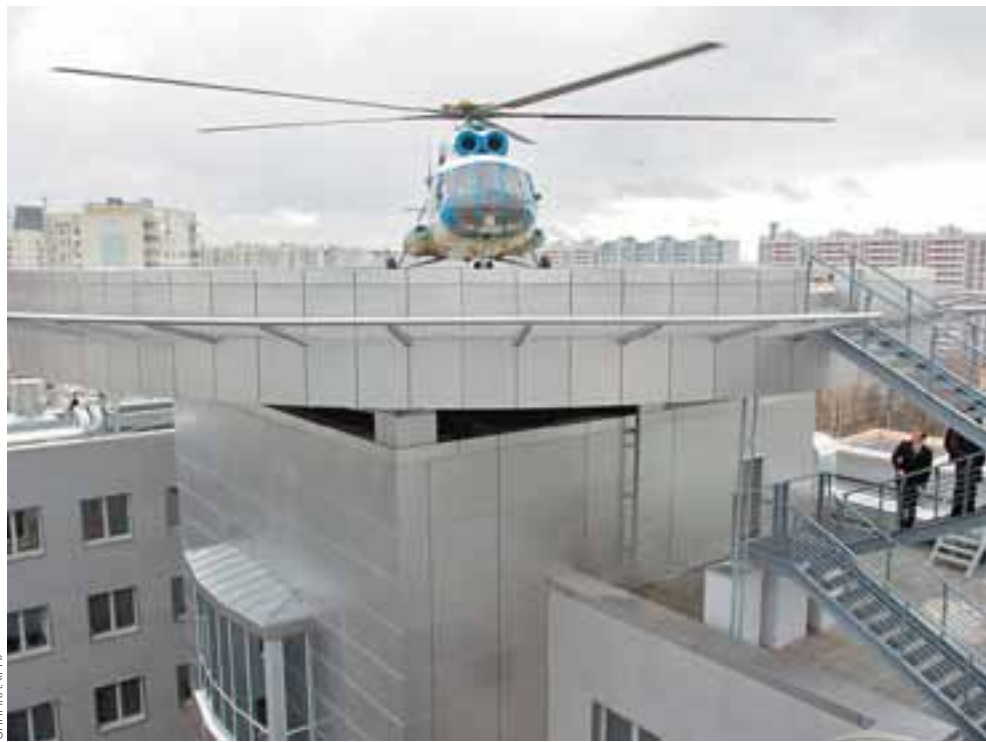
Новото здание, в което се премести знаменитият „аквариум“

Сега нека да разкажа за партньорството в работата на спецслужбите от различните страни. ГРУ участва в този процес и си сътрудничи с военното разузнаване на много страни. На срещи с колеги от чуждите спецслужби обменяме мнения и оценки на обстановката в света