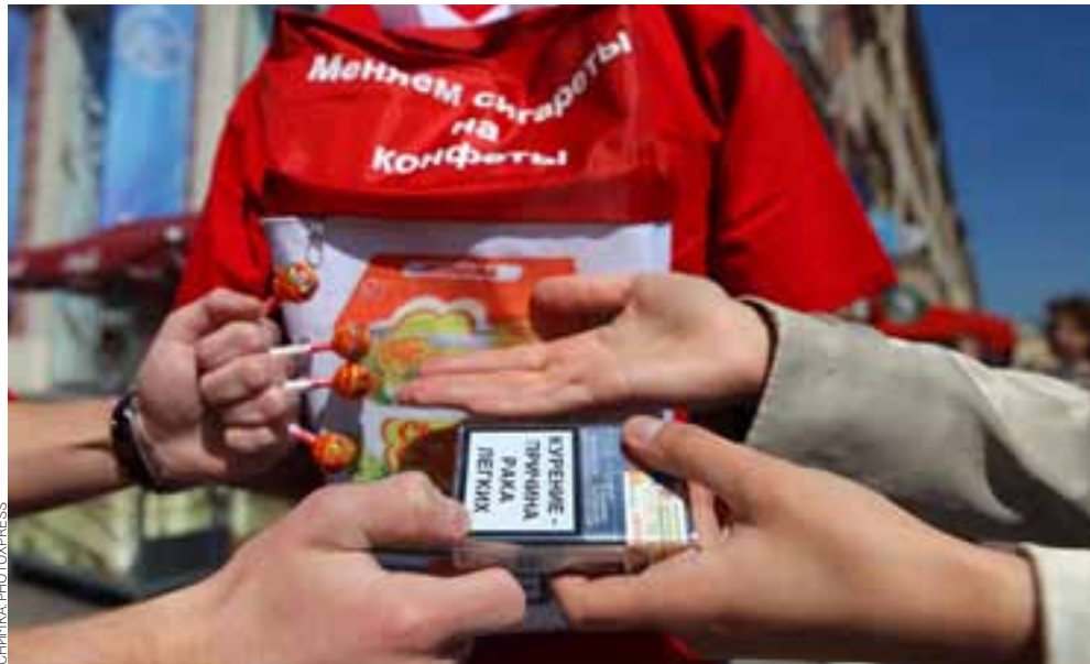
Капка никотин убива кон, но осъзнаването на тази истина не влияе на броя на пушачите

Наскоро българската агенция за приватизация и следприватизационен контрол в качеството си на продавач прехвърли на базираната в Австрия "БТ Инвест" (представляваща интересите на "ВТБ Капитал") 5 881 380 акции, което се равнява на 79,83% от капитала на "Булгартабак холдинг". И ето че в Роспатент вече са подадени 23 заявки за регистрация на търговски марки и названия. Освен предизвикващите носталгия у гражданите от бившия СССР "Родопи" и "БТ" в пакета заявки присъстват марки, известни по-скоро само на честите посетители на българските курорти – Inter, Seven hills, New Line, Femina, Prestige и други. Представителят на "ВТБ Капитал" твърди, че стратегията на компанията е насочена към разширяване на бизнеса и