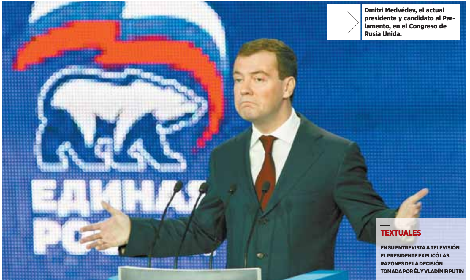
Dmitri Medvédev, el actual presidente y candidato al Parlamento, en el Congreso de Rusia Unida.

Y este no es el único ejemplo de un poco exitoso intento de integración de las repúblicas post soviéticas. Así, por ejemplo, Moscú y