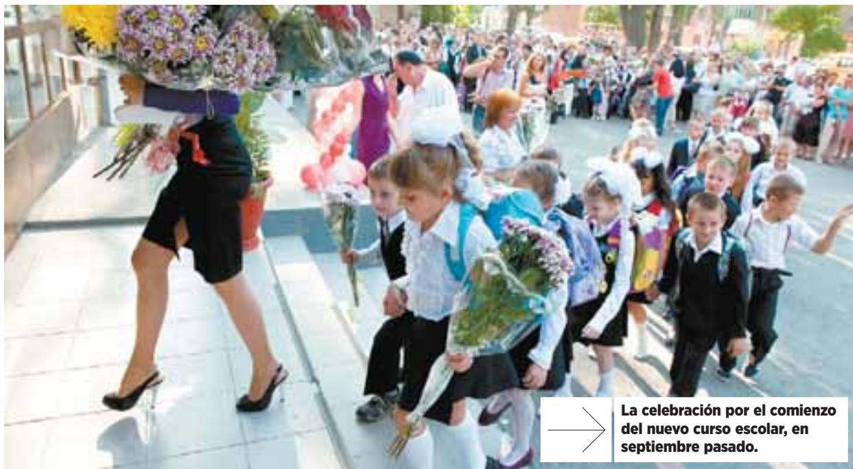
→ La celebración por el comienzo del nuevo curso escolar, en septiembre pasado.