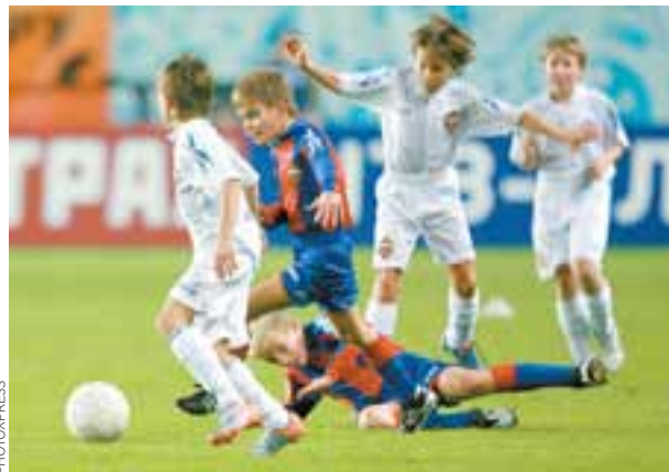
Los jóvenes futbolistas del CSKA moscovita.