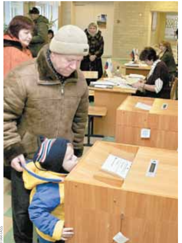
Uno de los colegios electorales de la capital.

No obstante, dicen los críticos, la Duma Estatal se ha convertido en un órgano que sella las decisiones del Kremlin con los votos de Rusia Unida sin dialogar con otros grupos parlamentarios.