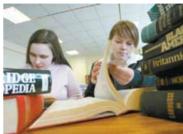
En Rusia existen 40 becas para los estudiantes argentinos.

La RUDN tiene cincuenta años. Nació como Universidad de la Amistad de los Pueblos "Patricio Lumumba" y en América Latina se la conoció como "la Lumumba". Fue creada para fomentar el desarrollo de pueblos que iniciaban en aquel en-