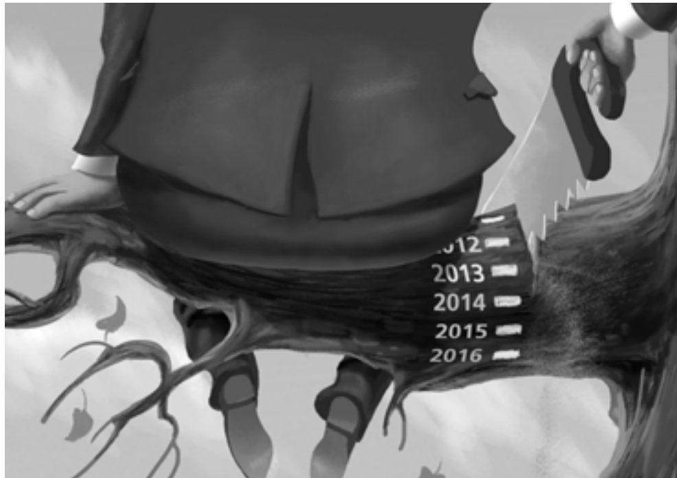
РИСУНКА: АНДРЕЙ ТКАЛЕНКО

Оказа се, че тази Система съвсем не е Абсолютната Истина, не е Върховото постижение