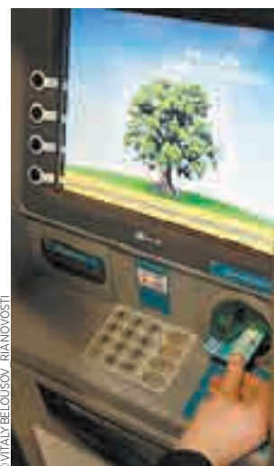
Pagamento de comissões pode atrapalhar medidas

“Se somarmos a esse valor as atividades criminosas e negócios ilegais, como o tráfico de armas, veremos que o mercado negro é responsável por entre 50% e 65% do PIB do país”, diz o analista da consultoria Rikom-Trust Vladislav Jukóvski. Recentemente, até mesmo o presidente do Banco Central da Rússia, Serguei Ignatiev, reconheceu que, em