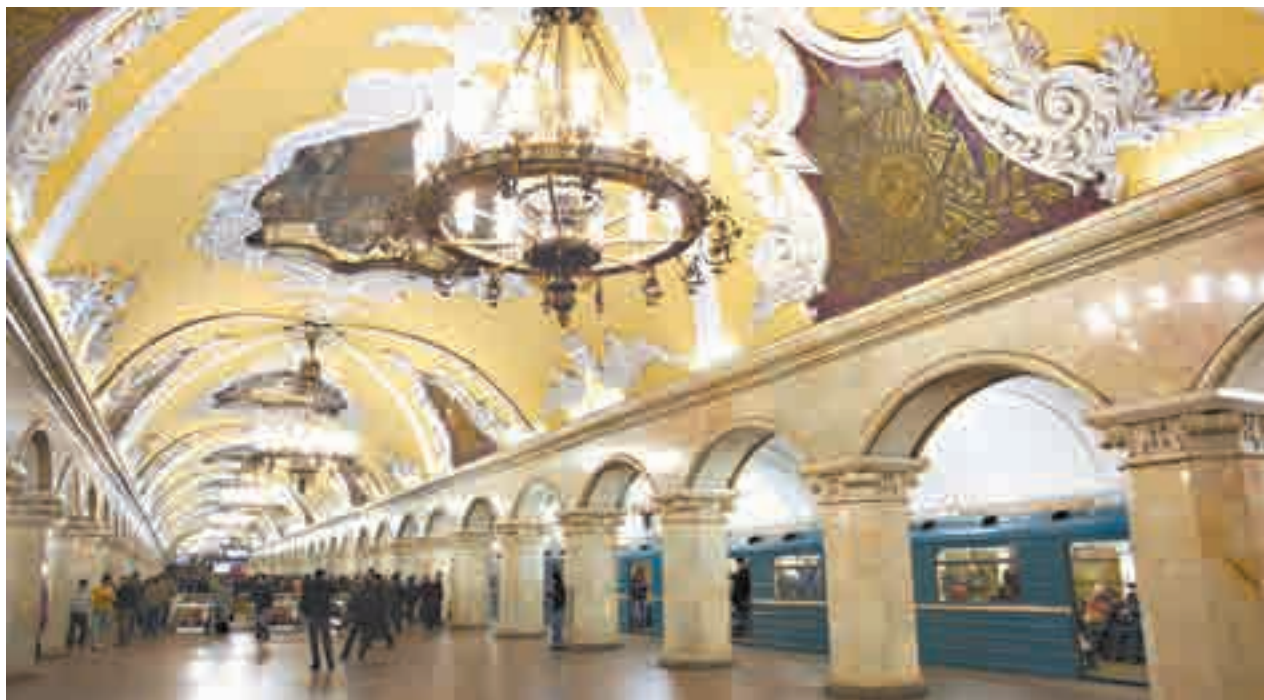
Além de ser um meio de transporte eficiente, o metrô de Moscou é inconfundível por sua exuberância

Além disso, um novo marco de Moscou foi inaugurado no icônico Parque Gorki em dezembro de 2011. Depois de uma reforma para limpar e modernizar a área durante a primavera e o verão, a maior pista de patinação no gelo da Europa foi construída à medida que o inverno se