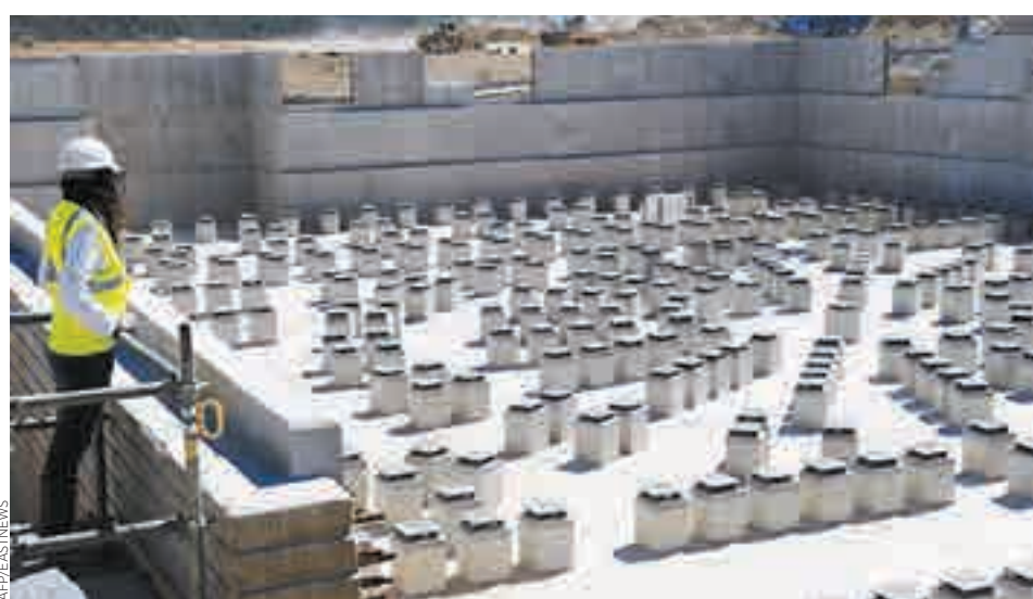
Brasil e Rosatom assinaram memorando ainda em 2009

De acordo com o plano de desenvolvimento da energia atômica nacional, o Brasil planeja construir quatro usinas nucleares até 2030. “Caso os brasileiros anunciem uma licitação para a construção de novos reatores nucleares,