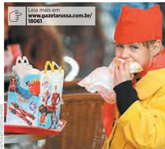
Restrição de publicidade: Rússia segue o exemplo europeu