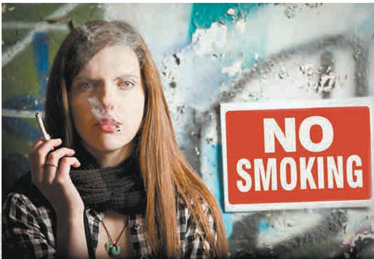
Quem infringir a nova lei terá que pagar multas de até 30 mil rublos (cerca de 2 mil reais)

As medidas devem dificultar muito a vida dos fumantes russos, que até então podiam acender seus cigarros livremente em restaurantes e outros locais fechados também durante o rigoroso inverno do país, que chega a temperaturas de até 30 graus negativos na capital. Agora, um indivíduo só