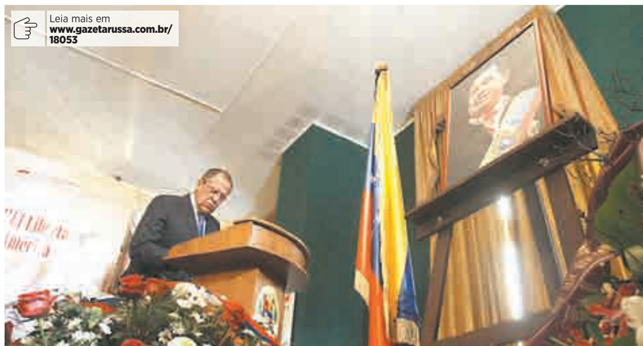
Ministro dos Negócios Estrangeiros russo, Serguei Lavrov, assina livro de condolências em tributo ao ex-presidente Chávez

Leia mais em www.gazetarussia.com.br/18053