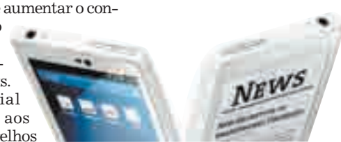
YotaPhone terá duas telas, uma “e-ink”

Internamente, o YotaPhone é equipado com um chipset da Qualcomm Dual-Core, 1,5 Ghz de velocidade, 2 GB de memória RAM e opção de 32 ou 64 GB de memória flash para armazenamento interno de dados do usuário. Cada uma das duas telas (tanto a principal, com resolução de 1280 x 720 pixels, como o segundo display, o “e-ink”) tem 4,3 polegadas.