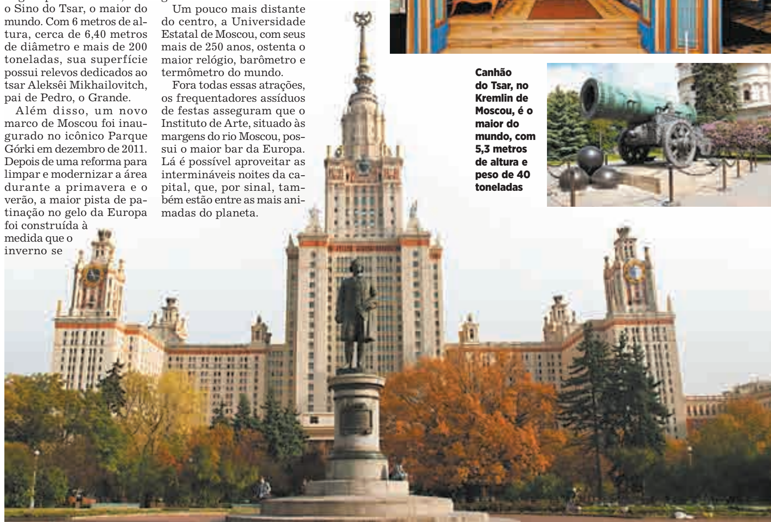
Fundada em 1755 pelo cientista Mikhail Lomonosov, a Universidade Estatal de Moscou é uma das "sete irmãs", os arranha-céus idênticos construídos sob Stálin