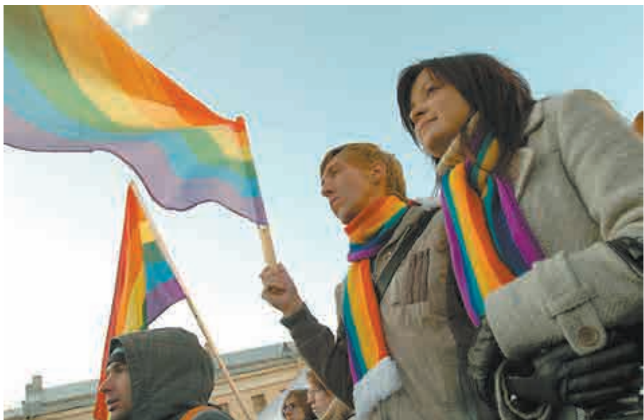
Rússia descriminalizou homossexualidade apenas em 1993, com o objetivo de ingressar no Conselho Europeu

Diversidade Comunidade acredita que lei possa restringir qualquer tipo de expressão LGBT